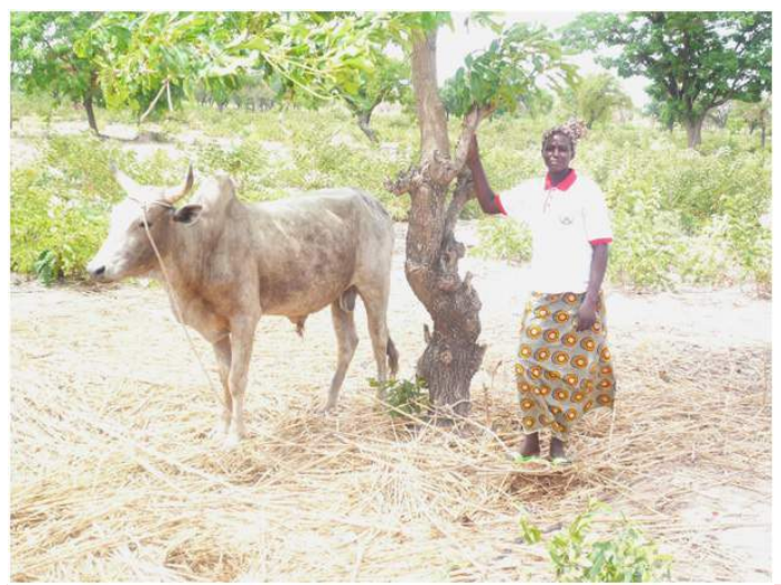
Boeuf du deuxième cycle d'embouche

Ainsi, pour assurer un maximum de bénéfices aux femmes, nous avons convenu de prolonger ce projet dont la fin était prévue pour janvier 2016. Au lieu de faire le dernier cycle d'embouche comme prévu, nous allons encore faire 2 cycles afin de permettre aux 25 femmes bénéficiaires d'épargner plus sur les ventes de leur animal en fin de cycle.