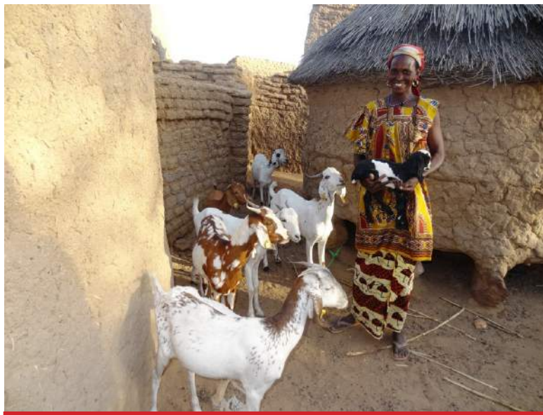
Bénéficiaires avec ses chèvres sur le projet Sarelo 2013

Nous discutons actuellement avec VSF-B pour poursuivre notre partenariat dans cette région du pays où les besoins sont encore très importants.