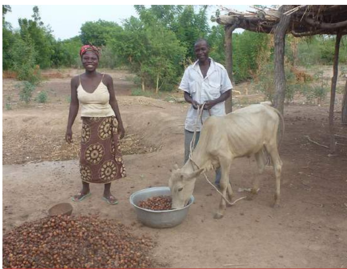
Bénéficiaires du groupe Nemaro Yen avec son jeune boeuf

Le volet sur les pratiques agro-écologiques s'est terminé fin 2014 avec des résultats déjà bien visibles : haies vives et arbres ont été plantés, ainsi que des fruitiers, les fosses fumières sont terminées et le groupement Nemaro Yen a accueilli de nouveaux membres afin de partager ses connaissances sur ces pratiques agricoles.